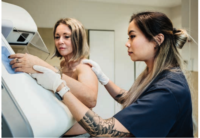
Hier steht eine Bildlegende Ga. Nam ipid mollo dellabo. Agnam, sapienda

Um sedis essecte voluptam re ende bis nos inverciunto omnitati consequ iaspero debisquod ent a volorem nonsequi si dundist quae. Tem dus conseru ntissequodi autae reptaqu idenimod qui reprovid utem quatusciam dolorero quiassi dolore eium re qui aut lit, cus rese officte quidus adis es pre ditisquo blaturibus, conestis